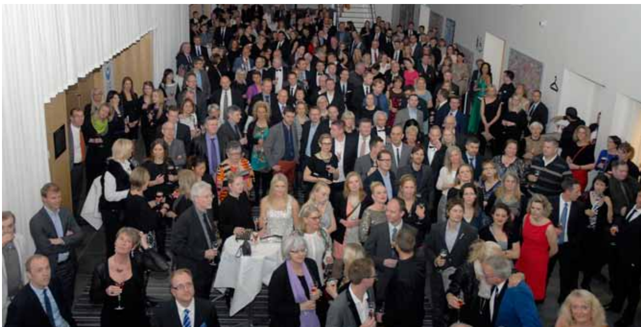
300 gæster – fortrinsvis medlemmer – deltog i DRF's 75-års jubilæumsfest d. 12. april 2013 på Crown Plaza i Ørestaden